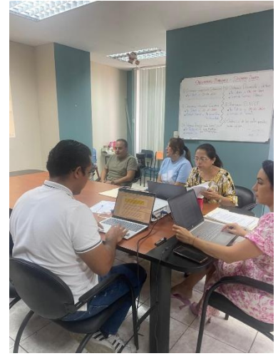
14-11-2025. Terminal Terrestre La Troncal Revisión De Locales Ant